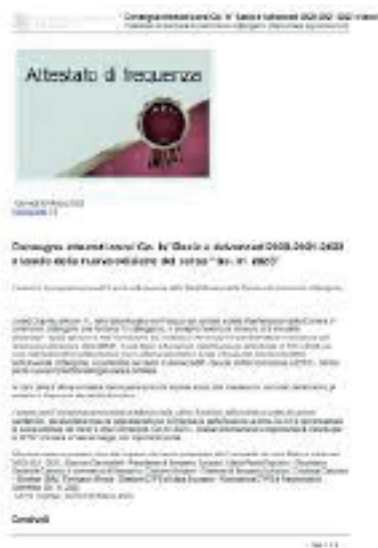
Corso di Alta formazione per le PMI – Go’In – Università degli Studi di Bergamo.