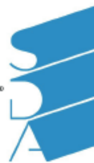
Corso e certificazione “Premiumization - da Marca a Premium Brand” – SDA BOCCONI, School of Management.