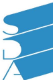
Corso e certificazione “Brand Management” SDA BOCCONI, School of Management.